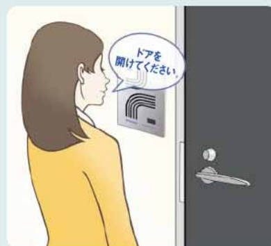
声紋認証入退出システム AmiVoice®Guard